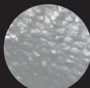
Solid Finish Nitrile Gloves

ตัวถุงมือทำมาจากยางธรรมชาติ ป้องกันสิ่งได้อย่างมีประสิทธิภาพสูงสุด แต่ต้องหยิบจับ วัตถุที่มีลักษณะหยาบหรือสิ่งมือ และตัวถุงมือยังสามารถเก็บรักษาได้ง่ายแม้ใน สภาพแวดล้อมที่มีอุณหภูมิต่ำ