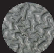
Crinkle Finish Latex Gloves

มีส่วนประกอบหลักคือเรซินซึ่งมีความยืดหยุ่นและทนทานต่อน้ำมันมากกว่ายางที่สังเคราะห์จากยางธรรมชาติและยังป้องกันการเกิดอาการแพ้รวมถึงมีการนำเทคโนโลยีการเคลือบด้วยโพลีเมอร์ซึ่งเป็นเทคโนโลยีที่ได้รับความนิยมในปัจจุบันและนานาประเทศมาอย่างยาวนานซึ่งการเคลือบด้วยโพลีเมอร์นี้จะช่วยเพิ่มประสิทธิภาพในการทำงานและสามารถช่วยในเรื่องการระบายอากาศการเคลือบด้วยไนโตรจะทำให้ถุงมือมีการใช้งานที่ยาวนานและมีความทนทานต่อสภาพอากาศหรือสิ่งแวดล้อมในการทำงานที่มีการเปลี่ยนแปลงบ่อยรวมถึงทนต่อความชื้นอีกด้วย